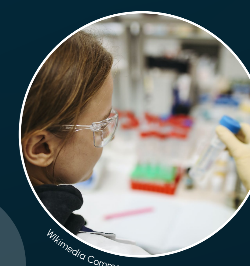
TABLA DE LOS PRINCIPALES BENEFICIOS PARA LA SALUD PROCEDENTES DEL OCÉANO

Los bioactivos son moléculas que encontramos en varios organismos con propiedades antibacterianas, antifúngicas, antiinflamatorias o anticancerígenas. La biotecnología marina busca estos efectos y la forma de convertirse en medicamentos. Muchos de los organismos que producen estos bioactivos son especies sensibles, y actualmente están en riesgo por la contaminación, pérdida de hábitat y cambio climático.